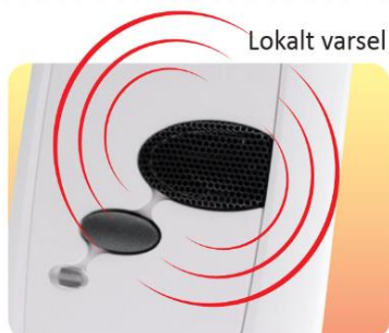
Sirene og tale