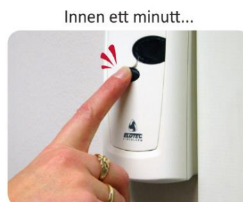
Varsling avstilles m/ ElotecnIQ